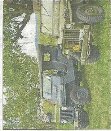
Keine Oldtimer-Ausstellung ohne Militärfahrzeuge.

Transporter, macht sich ans Aufräumen und freut sich sicher auf das nächste Oldtimertreffen 2017.